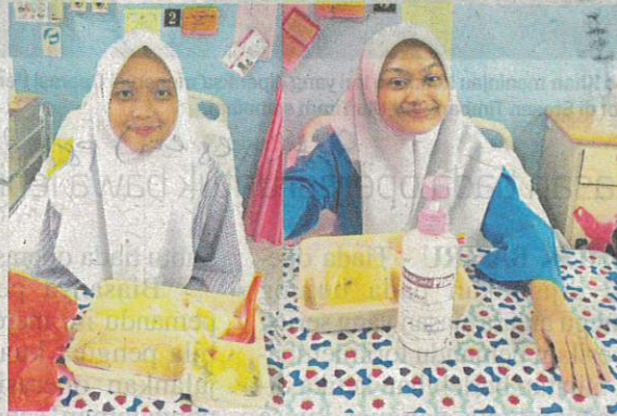
Pelajar MRSM Kuala Klawang yang dimasukkan ke Hospital Jelebu kelmarin akibat keracunan makanan.

“Bagi memastikan kebajikan dan keperluan pelajar dapat dipenuhi sepanjang tempoh penggantungan ini, perkhidmatan penyediaan makanan sementara akan dilaksana oleh pembekal perkhidmatan makanan berma-