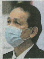
DR NOOR HISHAM

Bagi kes positif mengikut negeri, selain Sabah yang mencatat bilangan kes terbanyak, Selangor merekodkan 114 kes, Kuala Lumpur (20), Pulau