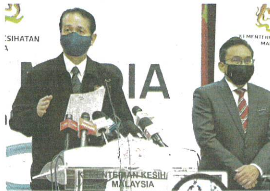
Dr Noor Hisham pada sidang media harian berkaitan jangkitan COVID-19 di Putrajaya, semalam.

"Antara sebab mereka membuat panggilan disebabkan faktor sosial seperti hilang pekerjaan, tiada pendapatan, masalah hubungan, persepsi negatif orang sekeliling, bimbang kepada jangkitan dan masalah tempat kerja," katanya dalam satu kenyataan, di-