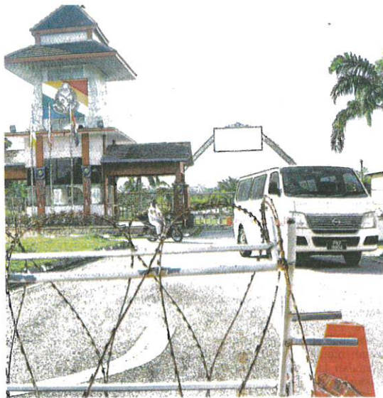
AMBULANS membawa pesakit Covid-19 dari Kompleks Penjara Seberang Perai, Jawi di Seberang Perai Selatan ke hospital semalam.

Beliau berkata, Kluster Inai pula turut melibatkan daerah Kudat dengan kes indeks yang