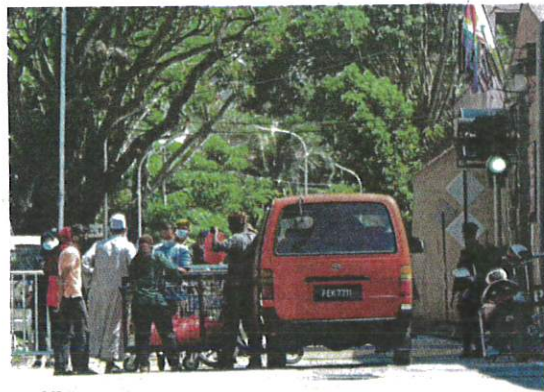
Penang Remand Prison staff receiving food contributions from members of the public in George Town yesterday.

"In Kedah, the RO takes into account positive cases from prisons. If we exclude them, the number will probably be lower.